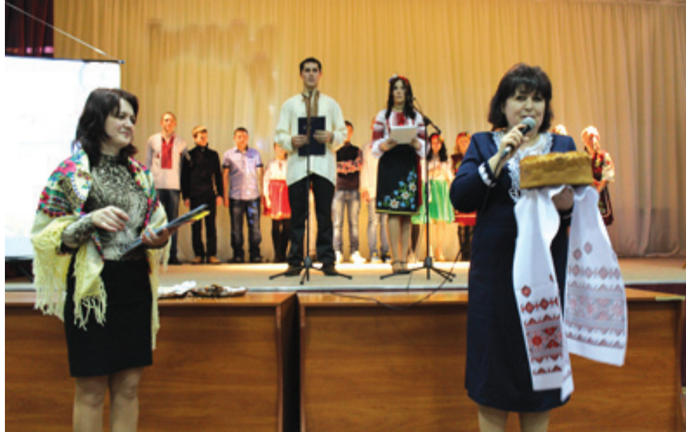
Учні групи №1 під час тетралізованої постановки «Калита»