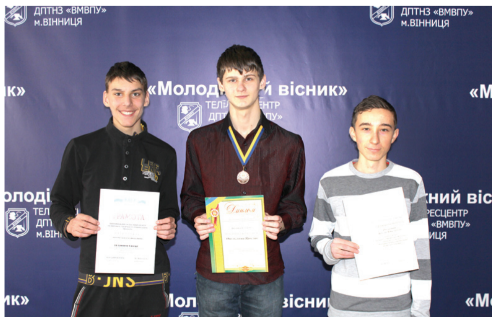
Команда ДПТНЗ «ВМВПУ» - учасники туру III Всеукраїнської олімпіади з інформаційних технологій

У суботу, восьмого лютого, в місті Вінниця проходив III (обласний) тур III Всеукраїнської олімпіади з інформаційних технологій. О дев'ятій годині ранку на базі Вінницького технічного ліцею зібралося 176 учасників з усіх куточків Вінницької області. Це були учні, які зайняли призові місця у олімпіаді з інформаційних технологій у своїх районах (II тур). Кожен із учасників відстоював честь свого населеного пункту і мені пощастило бути одним із них.