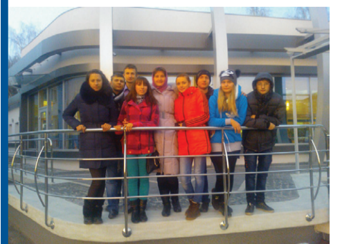
"Зимовий марафон" - С.14