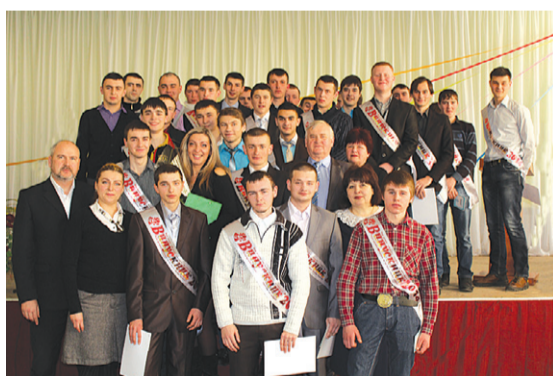
Випускники групи №44 із представниками адміністрації навчального закладу

А за ним - тривоги, праця, відкриття. Та такий він чистий і такий жаданий... Хай таким і буде все Ваше життя!