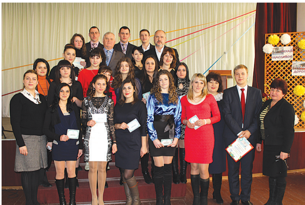
Випускники групи №48 із представниками адміністрації навчального закладу

Щиро бажаю вам, шановні випускники, міцного здоров'я, успіхів, особистих перемог, реалізації задумів і творчих планів!