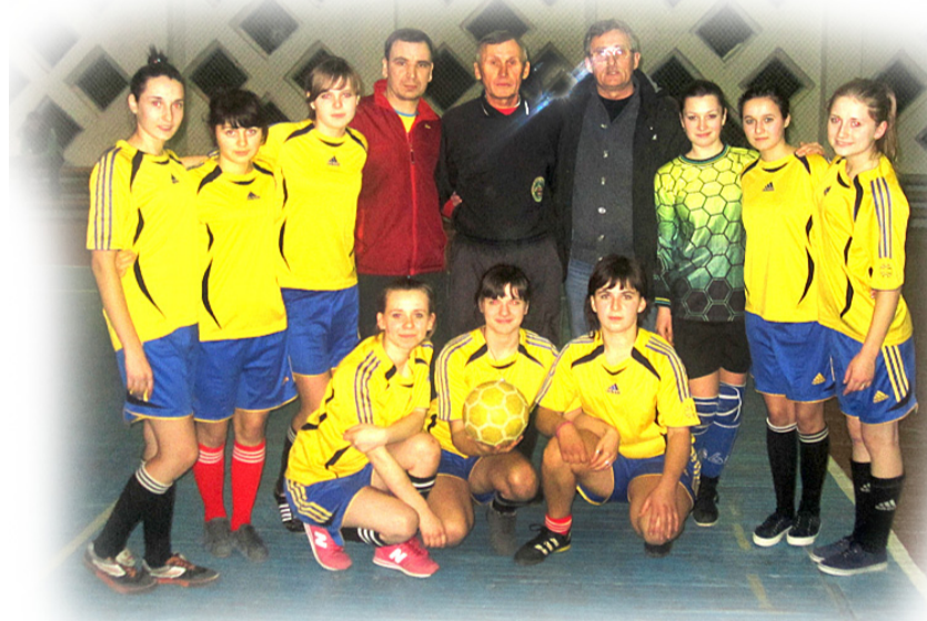
Команда ВМВПУ із футзалу

15 лютого 2014 в м.Літині відбувся Чемпіонат Вінницької області з футзалу серед дівчат 1997-99 р.н. сезону 2014 року. У Чемпіонаті взяли участь 12 команд: наша команда ДПТНЗ "ВМВПУ", "Він-Кар" (Вінниця), "Астарта" (Хмільник), "Патріот" (Мог.-Подільський), "Колос" (Козятинський р-н), Пед. коледж (Вінниця), ДЮСШ (Турбів), ПТУ 4 (Вінниця), ДЮСШ (Липовець), ДЮСШ (Літин), ПТУ 19 (Вінниця), Мед. коледж (Вінниця), "Інтеграл" (Вінниця).