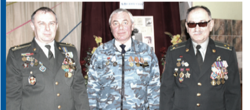
Факти - вперта річ - С.3

Гірка пам'ять: Афганістан болить у наших душах - С.2