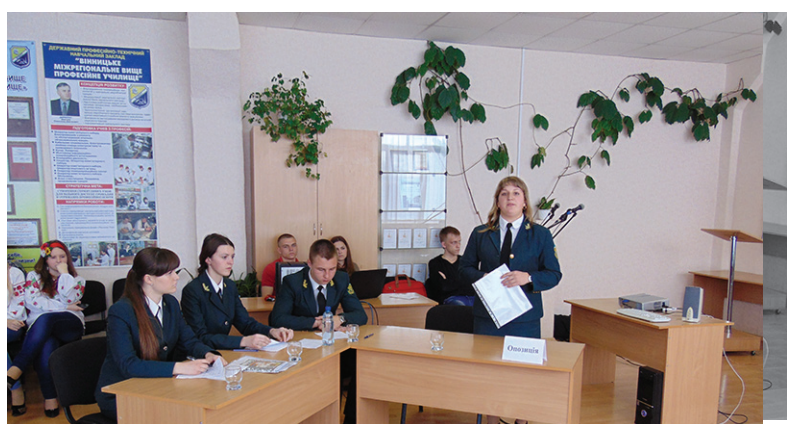
Команда КФЕК НУДПСУ