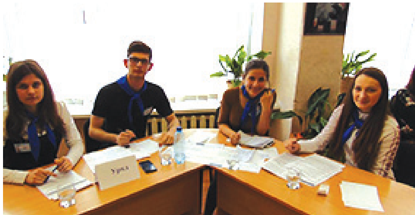
Команда ДПТНЗ «ВМВПУ»