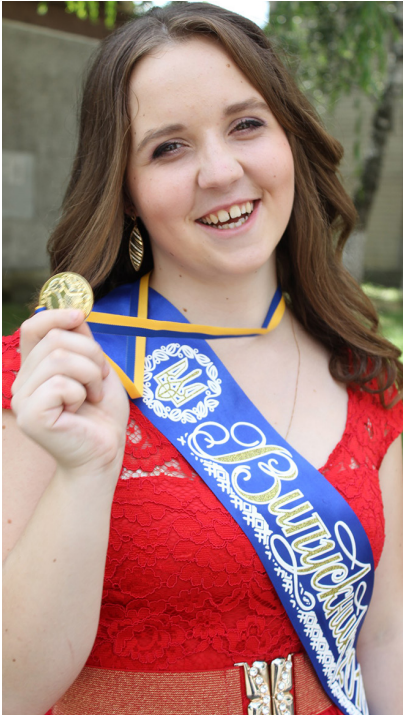
Шановні викладачі та учні, вітаю Вас із 75-річчям ДПТНЗ «ВМВПУ»!

В училищі я навчалася за спеціальністю «Оператор комп'ютерного набору. Обліковець з обробки бухгалтерських даних.»